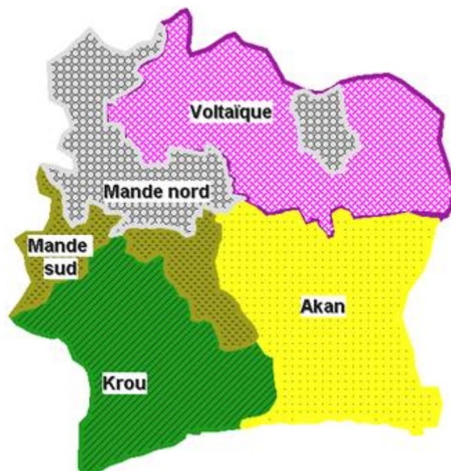
Carte n°3 : Les ethnicités en Côte d'Ivoire